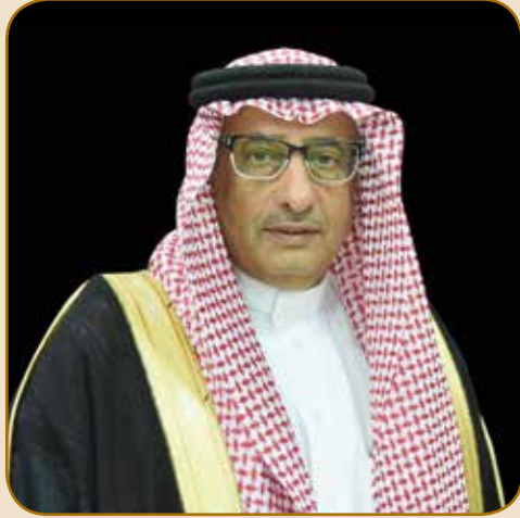
معالي مدير الجامعة أ.د. فلاح بن فرج السبيعي